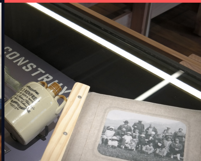
EXPOSICIÓN PERMANENTE MUSEO DE SITIO "CONSTRUCCIONES DE LA SOCIEDAD INDUSTRIAL DE AYSÉN".