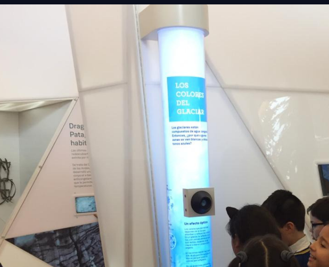
EXPOSICIÓN REGIONAL PERMANENTE "POBLAR Y HABITAR LA REGIÓN DE AYSÉN"