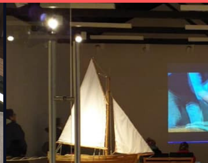
SALA DE EXPOSICIONES TEMPORALES