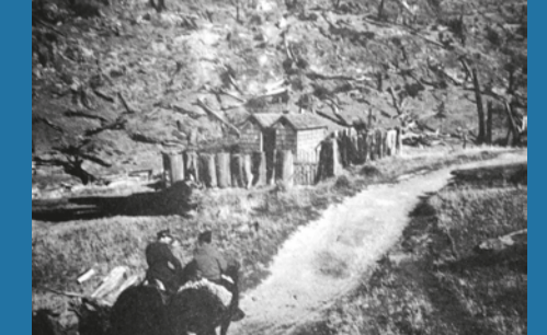
Primer registro fotográfico del cementerio de la familia Berrocal.

Dentro de las personas sepultadas en este camposanto se encuentran miembros de la familia Pinuer, Calderón, Jara, Millapinda, Pinilla, Arce, Poblete y Hermosilla.